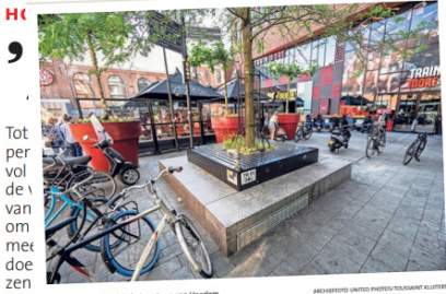
De omstreden zitplek in het centrum van Haarlem.

'De binnenstad is wel van ons allemaal!'