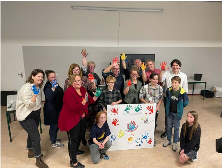
Oktober 2021. De eerste 13 organisaties zetten hun handtekening.

We beogen om in oktober 2022 de website met de digitale sociale kaart te presenteren.